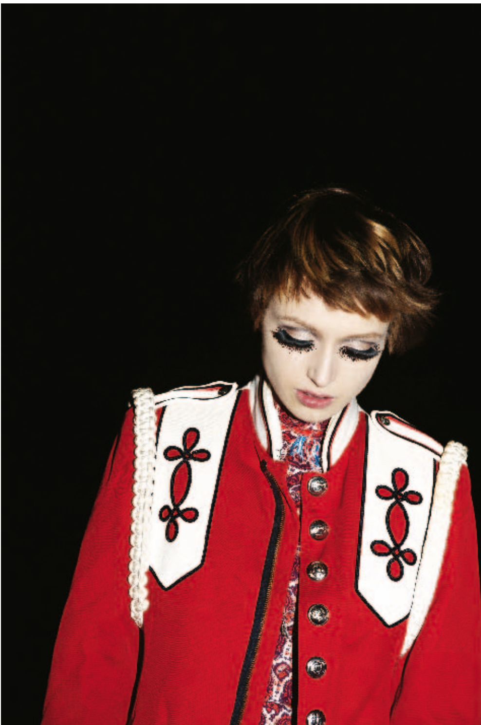
Beim Anprobieren einer Uniformjacke in ihrem Lieblings-Secondhandladen. Ein Freund der Mutter sagt: »Sie spielt, ein Model zu sein, ohne es zu sein«

dem Bett gefallen. Im stern hat er vor zwei Jahren gesagt: »Vaterschaft war für mich etwas, das sich erst über die Jahre entwickelt hat. Ich bin nicht gut im Umgang mit Babys, die machen mir irgendwie Angst.«